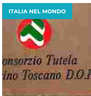
ECCELLENZE TOSCANE A TAVOLA FANNO SQUADRA E VOLANO A LONDRA