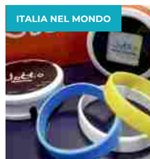
ECCO “JOTTO”, LA RISPOSTA TUTTA ITALIANA A NEST (GOOGLE)